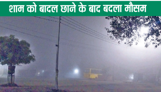
रेवाड़ी। वीरवार रात्रि कोहरे में लिप्त अनाजमंडी।

मौसम का मिजाज बार-बार बदल रहा है। हल्की बारिश के बाद शुरू हुआ कड़ाके की ठंड का दौर जारी है। ठंड के बीच जब भी सूर्य देव अपनी चमक दिखाते हैं, तो लोगों के चेहरे खिल जाते हैं। आसमान में बादल छाते ही ठंड का प्रकोप बढ़ जाता है। लगभग एक सप्ताह तक मौसम इसी तरह का बना रह सकता है। फरवरी के शुरू में ही बारिश के साथ ओलावृष्टि की आशंका किसानों की चिंता बढ़ाने