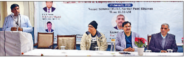
रेवाड़ी। संगोष्ठी में जानकारी देते मुख्य वक्ता व मौजूद शिक्षक।