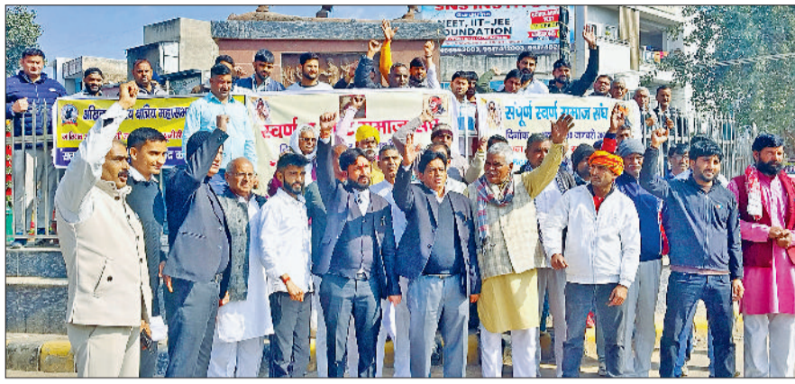
रेवाड़ी। यूजीसी एक्ट को लेकर प्रदर्शन करते सर्व समाज के लोग।

यूजीसी-एक्ट पर पुनर्विचार करके संसोधन करने की मांग की। वक्ताओं ने कहा कि यूजीसी एक्ट के काले कानून को किसी भी कीमत में बदरित नहीं किया जाएगा। सरकार समाज को बांटने का कार्य कर रही है। उन्होंने यूजीसी एक्ट की मुगल व अंग्रेजों के कानून से तुलना भी की। शुक्रवार को संपूर्ण सवर्ण समाज संघ व अखिल भारतीय क्षेत्रीय महासभा ट्रस्ट के सैकड़ों सदस्य महाराणा