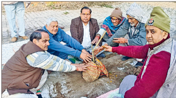
रेवाड़ी। होली पर्व के उपलक्ष्य में डांडा रोपने की परम्परा निभाते ग्रामीण।