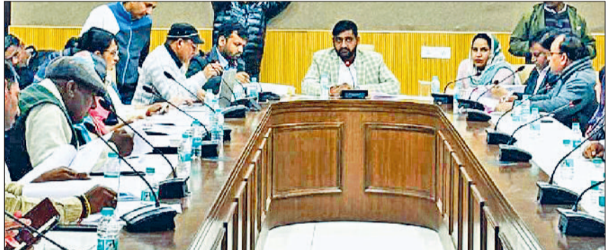
रेवाड़ी। जिला परिषद की बैठक लेते जिला प्रमुख व मौजूद पार्फंद।

बैठक में जिला प्रमुख ने बताया कि जिला परिषद को स्टॉप ड्यूटी के रूप में कुल 17.09 करोड़ रुपये प्राप्त हुए हैं। इस राशि में से 34 लाख रुपये जिला प्रमुख कार्यालय के खर्च में समायोजित किया जाना है। इस खर्च को छोड़कर शेष बची 16.75 करोड़ रुपये की राशि का लगभग 250 प्रस्तावित विकासकार्यों के लिए आवंटन किया गया है।