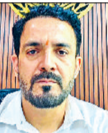
डीलरों के बहकावे में नली आना चाहिए।

कोर्टोव परिया में बिना अनुमति निर्माण किसी भी स्तर में बर्दाश्त नहीं किए जायेंगे। प्लांट खरीदने वाले लोगों को नुकसान से बचने के लिए पहले डीटीपी कार्यालय आकर कॉलोनी के नियमित होने के बारे में जानकारी लेनी चाहिए। उन्हें प्रॉपर्टी -मंटीप सिंहाग, डीटीपी।