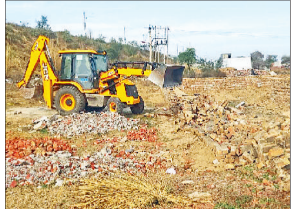
रेवाड़ी। अवैध कॉलोनी का निर्माण तोड़ती जेसीबी।