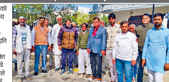
रेवाड़ी। ग्रामीणों को जागरूक करते हुए पुलिस टीम।