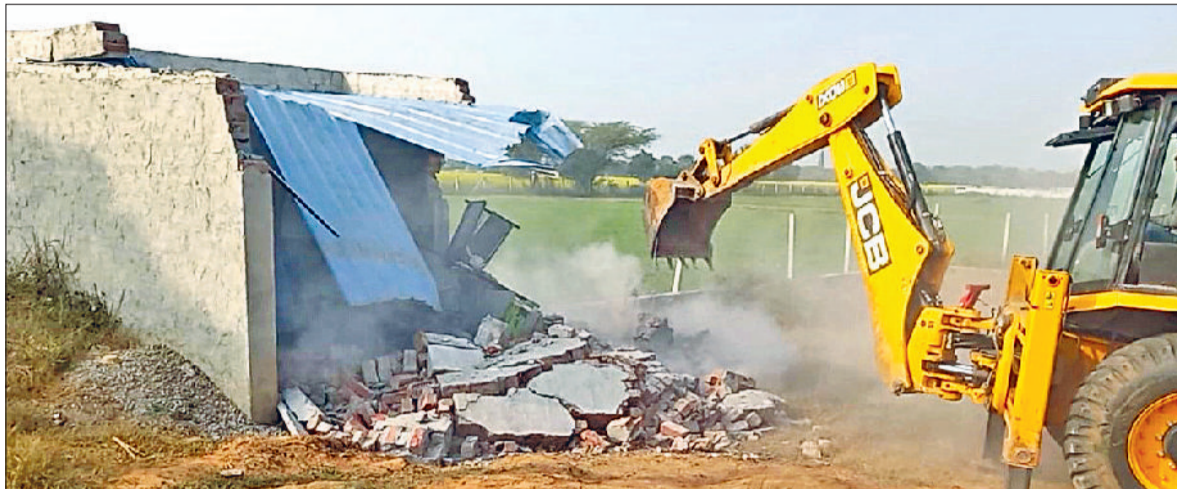
रेवाड़ी। अवैध कॉलोनी में निर्माण तोड़ती जेसीबी। फाईल फोटो।

जनवरी माह के दौरान डीटीपी की टीम ने 9 कॉलोनिनों को जेसीबी चलाकर ध्वस्त कर दिया। लगभग 40 एकड़ में निर्माण तोड़ दिए गए। इसके बाद भी नई कॉलोनिनों काटने का सिलसिला बंद नहीं हुआ है। कॉलोनाइजर लगातार प्लांटिंग के खेल में मस्त हैं और आम लोगों को इसका खामियाजा भुगतना पड़ रहा है। डीटीपी की ओर से जनवरी माह में लगभग हर तीसरे दिन अवैध रूप से विकसित की जा रही कॉलोनिनों को जेसीबी से धराशाही करने की कार्रवाई अमल में लाई गई है। इस कार्रवाई के दौरान प्रोटेक्टर चारदीवारीयों से लेकर डीपीसी तक को तोड़ा गया है। डीटीपी की ओर से अवैध कॉलोनिनों विकसित